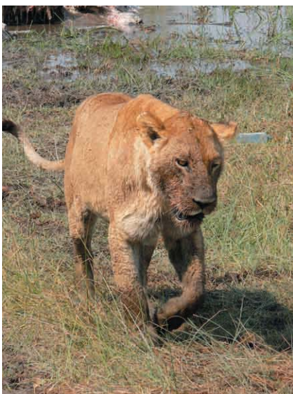
Löwin im Moremi unweit des gerissenen Hippos, August 2006

Chobe River aufmachen. Auch für diese Entscheidung sind wir offen und flexibel vor Ort.