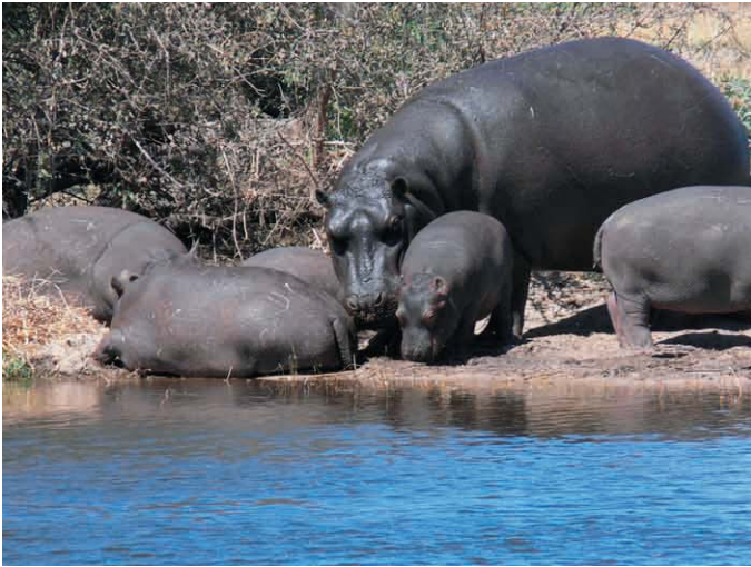
Hippowebchen mit Jungen auf einer Insel im Khwai River, August 2006

durch das Aufspüren von kleinen bis riesigen Löwenrudeln, oft angekündigt durch Geier in den Bäumen, die angelegentlich auf ihren Zugriff auf die Beute warten.