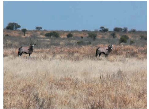
Sie sind die typischen Bewohner der südlichen Kalahari: Oryxe und Springböcke, CKGR, September 06