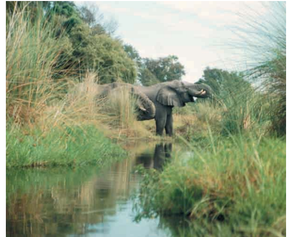
Unterwegs im Okavango-Delta. Im Mai 2005 (Bild) war der Wasserstand sehr niedrig und die Elefanten kamen direkt an den Wasserarm zum trinken

6.5. Okavango Delta Heute geht es gleich schon richtig los. Um kurz nach sieben Uhr morgens werden wir mit einem (erfahrungsgemäß) vogelwildenen offenen Safarifahrzeug abgeholt und mitten ins Delta gebracht. Dort warten bereits die Pooler auf uns, die jeweils zwei Personen in einem Mokoro (Einbaum) durch das Delta staken werden. Dieses Jahr wurden wir mitten in eine Hippoherde gefahren, was bereits eine Menge Aufregung verursachte. Die River People, die ihr ganzes Leben am Fluss zugebracht haben, führen uns dann auf einen Bushwalk zu Fuß ins Gelände. Mit etwas Glück begegnen wir hier hautnah bereits den ersten Elefanten oder Zebras oder, oder, oder. Anschließend gibt es eine gemeinsame Brotzeit. Am späten Nachmittag erreichen wir wieder unser Camp.