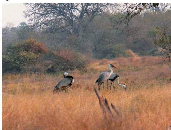
Kraniche an einem Wasserloch in der Nähe der Third Bridge, August 2006

7.5. Moremi Wildlife Reserve An diesem Tag machen wir uns ganz in der Früh in Richtung Moremi Wildlife Reserve auf. Die Anfahrt bis zum Gate dauert ca. zwei bis zweieinhalb Stunden - je nachdem wie viele Tiere uns schon unterwegs begegnen. Ab dem Gate kommt man dann aus dem Schauen meist nicht mehr heraus. Je nach Jahreszeit und Ergiebigkeit der sommerlichen Regenfälle erwarten einen sehr unterschiedliche Szenarien. Wasser- und Schlammfahrten, viele kleine Pools (mit oder ohne Hippos) können den Tag zum Abenteuer werden lassen. Genauso ist es aber möglich, dass das Land sehr trocken ist und sich die Tiere entsprechend an den wenigen Wasserstellen morgens und abends sammeln. Beide Situationen sind sehr reizvoll. Wir übernachteten an diesem Abend voraussichtlich an der Third Bridge (gemeinsam mit vielen, vielen Pavianen...)