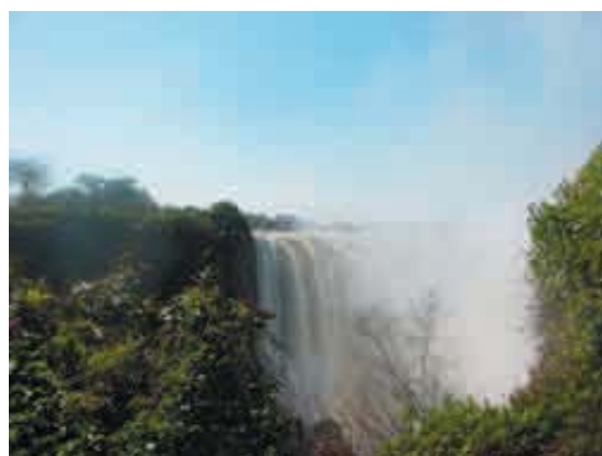
Die Victoria Fälle im Juni 2004 (von der Seite aus Simbabwe gesehen.)

Die angebotenen Touren sind privat organisiert. Unsere Fahrten finden alle in unserem eigenen Landrover Defender mit kompletter Campingausstattung statt. Unsere Reise ist insofern exklusiv, da wir garantiert eine kleine Gruppe sind, wo individuelle Wünsche viel mehr Platz finden können. Unser Auto ist kein Overlanderfahrzeug, was nur auf großen Straßen/Wegen unterwegs sein kann, sondern ein aufs Gelände abgestimmtes Allradfahrzeug, wo man auch die schönsten Nebenstrecken erforschen kann!