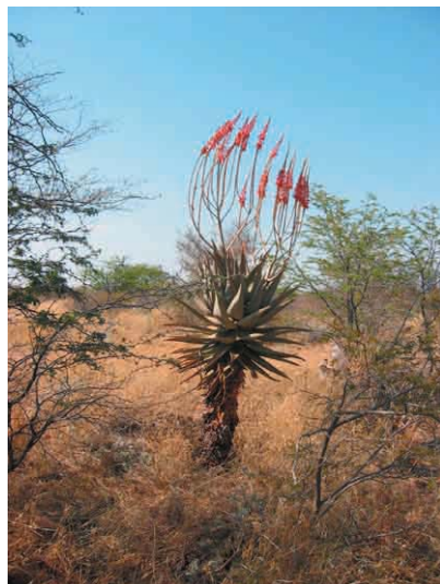
Faszinierende Blüten am Thakadu Camp, Sept. 2006

Er stößt im Süden an Südafrika. Zwischen beiden Ländern kann man innerhalb des Parks ohne Zäune hin und her fahren. Für die nächsten drei Tage haben wir uns aber die Erforschung der Mabuasehube Sektion vorgenommen. Diese befindet sich im nordöstlichen Teil des KTP und gilt als relativ einsamer aber wunderschöner Teil des Parks. Im KTP lebt alles, was die südliche Kalahari aufzubieten hat (Vom schwarzmähnigen Kalaharilöwen bis zur Kobra). Die Tierdichte ist aber aufgrund der extremen Weitläufigkeit eher niedrig einzuschätzen.