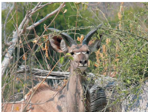
Kudu bei den Hippopools im Moremi Wildlife Reserve, August 2006

Dort werden wir die nächsten zwei Nächte in einem Bed and Breakfast verbringen. Euch erwarten also nach der Wildniss nun richtige Betten und Duschen.