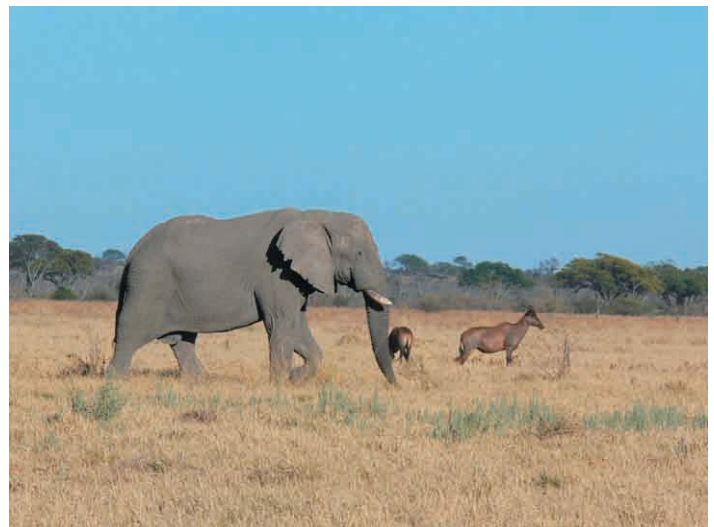
Elefant mit Tsessebees im Savuti, August 2006

11.5. Savuti Heute machen wir uns gleich zum Sonnenaufgang auf den Weg. Da wir an diesem Camp mindestens zwei Nächte verbringen, können wir die Zelte stehen lassen und einen morningdrive noch im Dunkeln starten. Belohnt wird man im Savuti oft